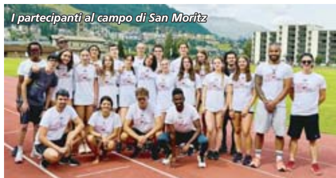
I partecipanti al campo di San Moritz