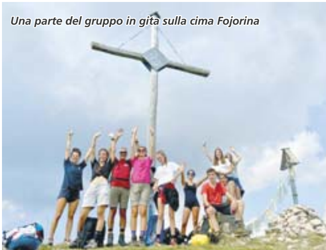
Una parte del gruppo in gita sulla cima Fojoirina

partecipa anche a «cool and clean» programma di prevenzione nazionale nello sport con consigli, informazioni ed esercizi di prevenzione per l'allenamento. E' quindi stata l'occasione per approfondire i temi legati alle "dipendenze" da fumo, da alcool e altro, così da favorire una scelta di vita, non solo sportiva, migliore. Accattivanti e coinvol-