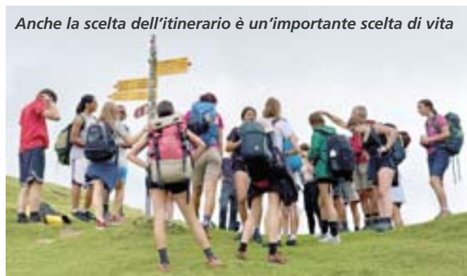
Anche la scelta dell'itinerario è un'importante scelta di vita