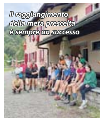
Il raggiungimento della meta prescelta è sempre un successo

montagna. Non si è voluto scolare chissà quale cima, ma semplicemente vivere un paio di giornate in amicizia, visitando nuove zone vicine a noi e fattibili a tutti. La salita al Passo San Lucio, la cima Fojoirina, il pernottamento alla capanna Pairolo e la gita attorno ai Denti della Vecchia sono state le mete scelte da oltre 25 partecipanti; fatica sì, ma in allegra compagnia, con l'unico scopo di conoscersi meglio e creare saldi legami.