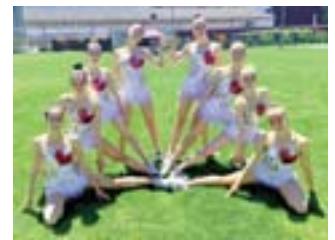
Alunne A: ginnaste esercizio al cerchio (oro)

Complimenti a tutte le ginnaste e alle monitrici per il lavoro svolto e un grandissimo in bocca al lupo per i Campionati ticinesi di sezione!