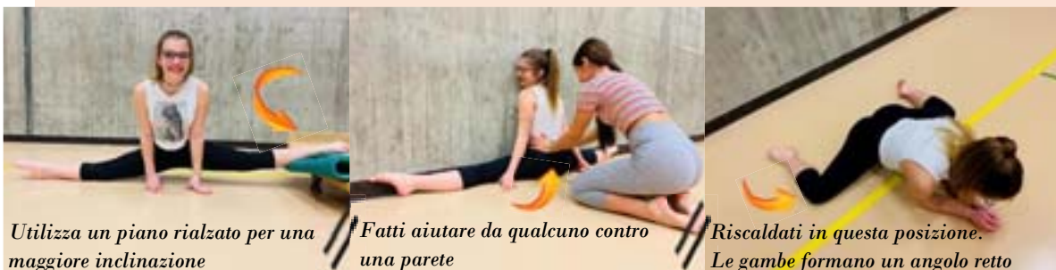
Utilizza un piano rialzato per una maggiore inclinazione