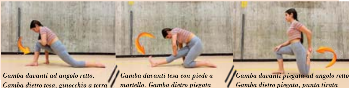
Gamba davanti ad angolo retto. Gamba dietro tesa, ginocchio a terra