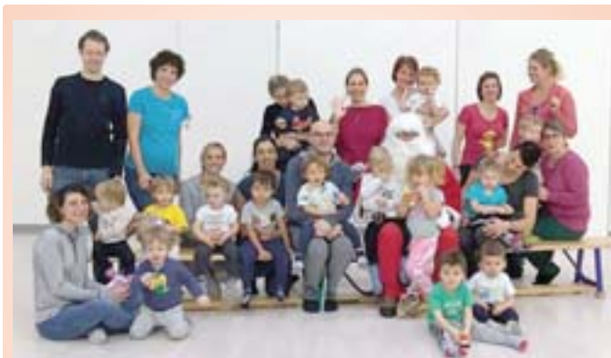
Per la gioia dei più piccolini oggi è arrivato a trovarci S. Nicolao. Ha giocato con noi, ha cantato e ci ha portato dei doni. Grazie S. Nicolao

Complimenti quindi a tutte per aver conquistato questo importante e prestigioso traguardo.