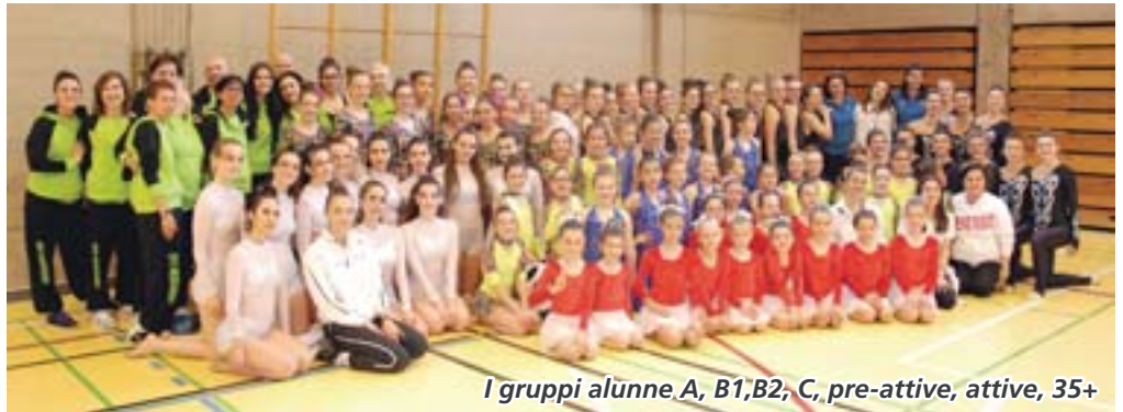
I gruppi alunne A, B1,B2, C, pre-attive, attive, 35+

Questa gara prende in considerazione solo la nota "P" (composizione) e permette ai monitori di avere una valutazione della produzione che, dopo i dovuti accorgimenti e a seguito del feed-back delle giurate, i