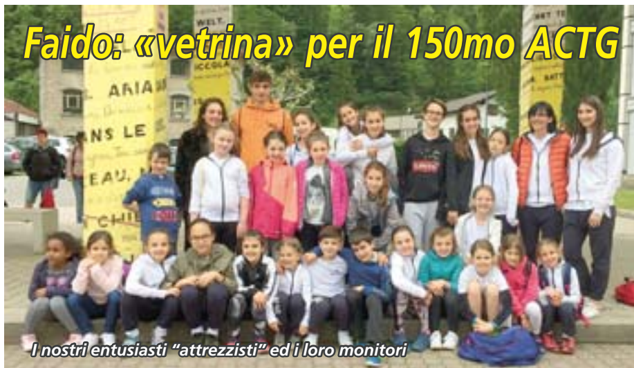
I nostri entusiasti "attrezzisti" ed i loro monitori

Grande successo ha riscosso , domenica 26 maggio, la giornata "vetrina" che l'ACTG ha voluto proporre e inserire nel programma di festeggiamenti per i 150 anni dell'associazione cantonale. Tra gli 800 partecipanti, pure un nutrito gruppo del nostro settore attrezzistico.