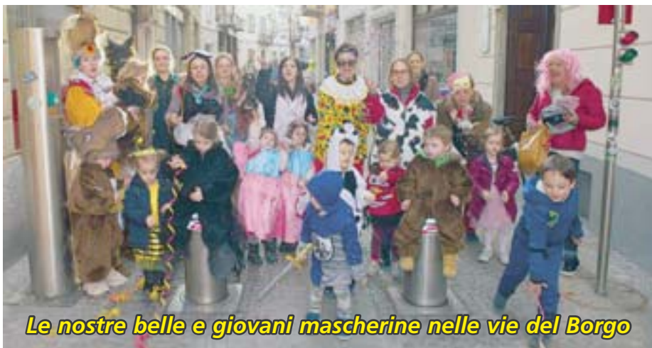
Le nostre belle e giovani mascherine nelle vie del Borgo