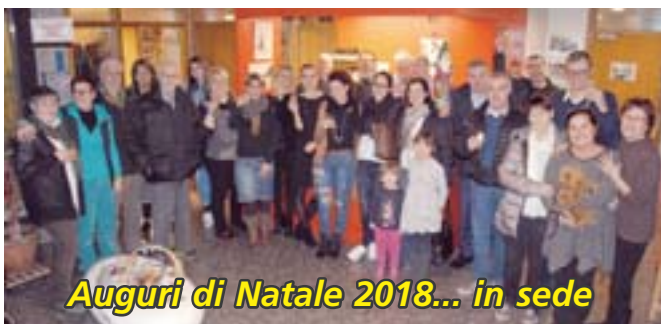
Auguri di Natale 2018... in sede