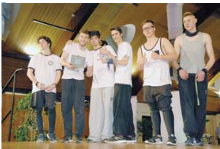
Il gruppo Parkour invitato ad esibirsi durante la serata