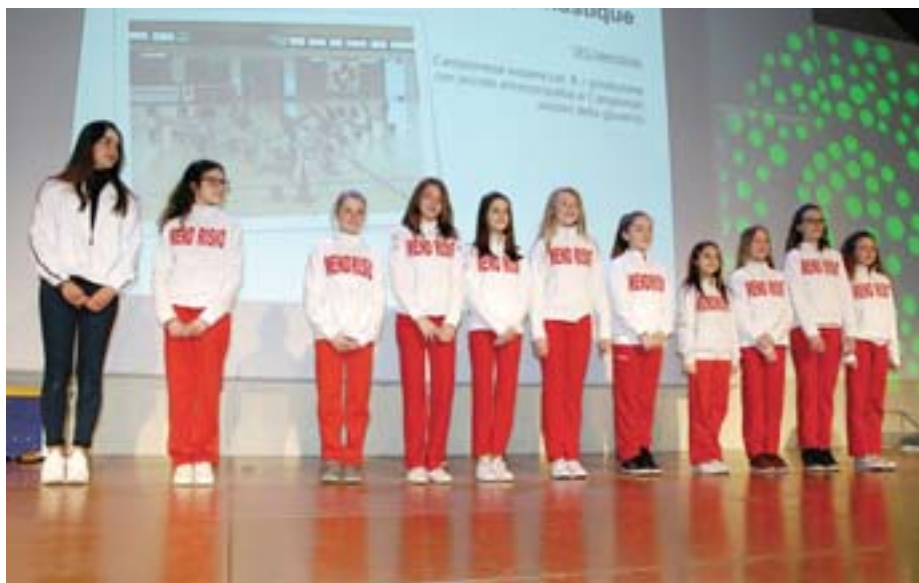
La squadra alunne, campionesse nazionali cat. B attrezzo ai giovanili

P.P. CH-6850 Mendrisio-Stazione Posta CH SA