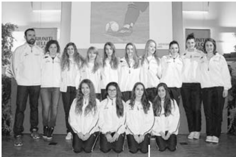
I nostri campioni svizzeri premiati dalla città di Mendrisio in occasione di Riuniti nello Sport

P.P. CH-6850 Mendrisio-Stazione Posta CH SA