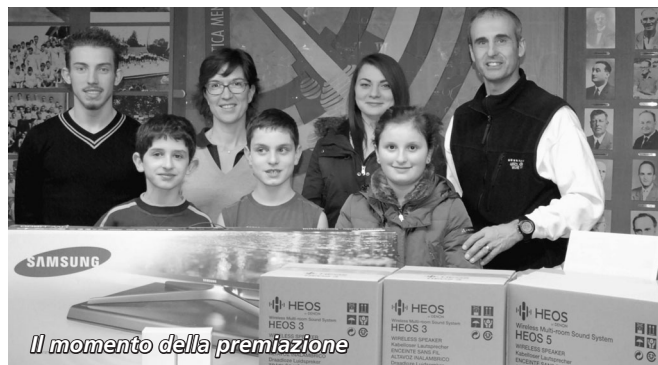
Il momento della premiazione