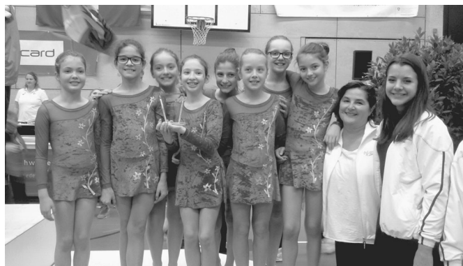
Alunne B1 palla terzo posto

giungono il punteggio di 8.79 che li porta a classificarsi oltre metà classifica. Impresa non facile anche perché confrontati in una categoria mista che prevede esercizi al suolo e parallele asimmetriche. Il contenuto tecnico e l'esecuzione è comunque di buon livello e i nostri ginnasti hanno saputo cogliere la sfida. Un week end vissuto con l'adrenalina al massimo per i nostri 50 ginnasti e i risultati lasciano ben sperare per il futuro.