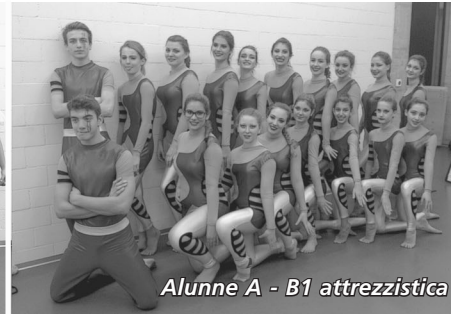
Alunne A - B1 attrezistica