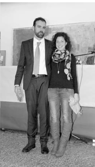
Assemblea ACTG 2015 - premiate le coppie mendrisiensi campionesse Svizzere ai recenti nazionali di categoria