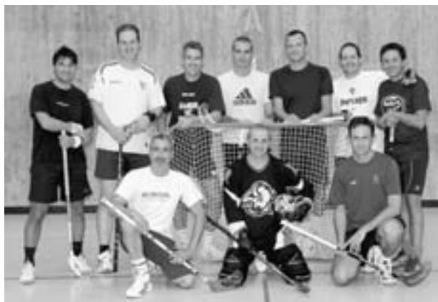
Dal settore giochi, una bella immagine dei nostri unihockeyisti