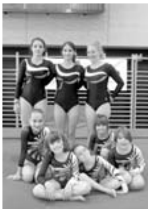
Finalisti CT attrezzistica