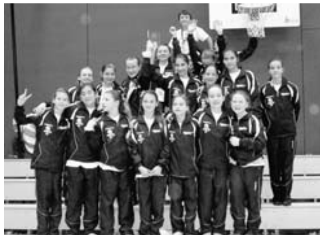
Il gruppo Alunni B, vice-campione svizzero nella categoria B alla Combinazione d'attrezzi

goria Combinazione d'attrezzi B. Per primi ad esibirsi con il loro consolidato esercizio ai salti e suolo, i ginnasti hanno da subito posto l'asticella piuttosto in alto: 9.05 la loro valutazione. Col passare delle produzioni si concretizzava l'opportunità di