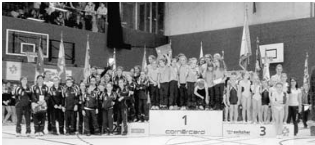
Il podio nella categoria Combinazione d'attrezzi B, SFG Mendrisio vice-campione svizzero

ritmica hanno presentato un primo esercizio libero nella categoria A. Per il loro lavoro, caratterizzato da una ricca coreografia e da una soddisfacente esecuzione, il gruppo ha ottenuto la valutazione di 8.700 corrispondente al 12 rango. Nella giornata di domenica erano previsti i concorsi con il piccolo attrezzo. Nella categoria B, il gruppo momò, con un esercizio al cerchio, è risultato ottavo con il punteggio di 8.83. Le giovani ginnaste erano alle prime armi e tanta era l'emozione di prodursi in una gara nazionale davanti ad un numerassi-