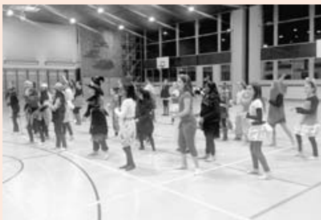
Mascherine-ritmiche in allenamento prima dell'incoronazione di Re Dormiglione