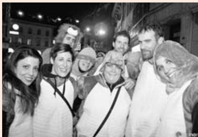
Presenti con una delegazione di Tartatughe al 150° Rabadan