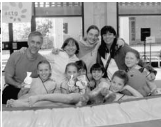
I ginnasti della C1A e C2 Maschile, le ginnaste della C1B e C1 A femminile