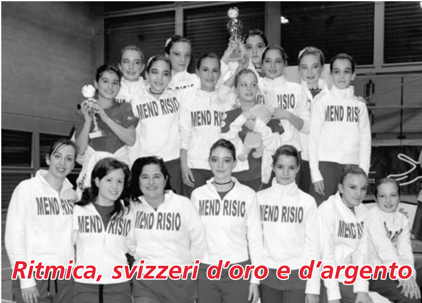
Ritmica, svizzeri d'oro e d'argento

www.sfgmendrisio.ch Esce ogni trimestre anno XVIII n. 2 dicembre 2010